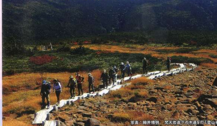
写真： 細井靖明 梵天若直下の木道を歩く登山者