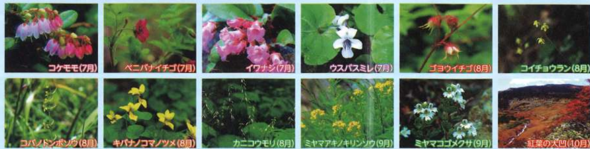
コケモモ(7月) ベニバナイチゴ(7月) イワナシ(7月) ウスバスマレ(7月) ゴウイチゴ(8月) コイチョウラン(8月) コバノドボンソウ(8月) キバナコマノツメ(8月) カニコモリ(8月) ミヤマアキノキリンソウ(9月) ミヤマゴメクサ(9月) 紅葉の大凹(10月)

西吾妻は、岩海や高層湿原が点在し、高山植物の宝庫です。北限・南限の植物が我先にと咲き誇ります。