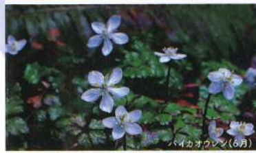
ハイオウクレン(6月)